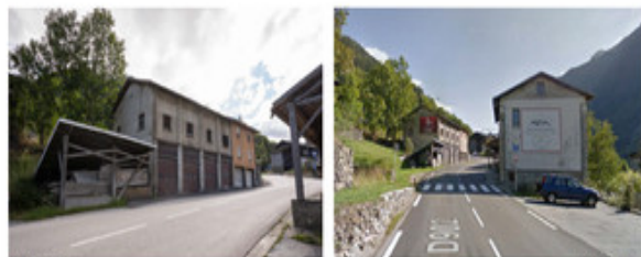
PC 1 - Vue gauche